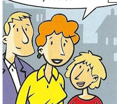
Doc 5 : Une famille autorisée à changer de nom

On me comprend enfin quand je me présente.