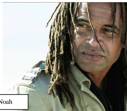
Doc 1 : Yannick Noah